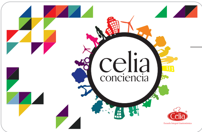
Acreditación e Ingreso